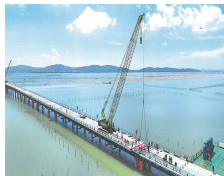
海上施工“大动脉”贯通